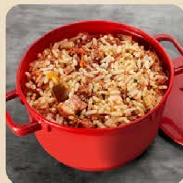
Arroz Carreteiro Swift