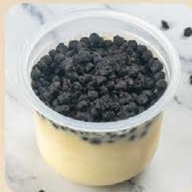
Mousse de Chocolate Branco com Biscoitos Swift