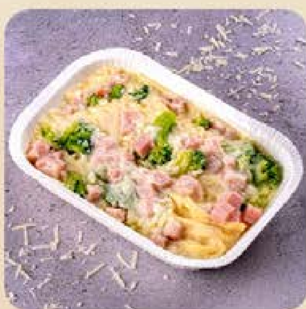
Fettuccine com Peito de Peru e Brócolis Swift

Praticidade e variedade com gostinho de feito em casa.