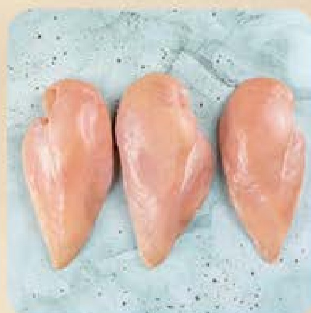
Filé de Peito Orgânico Seara