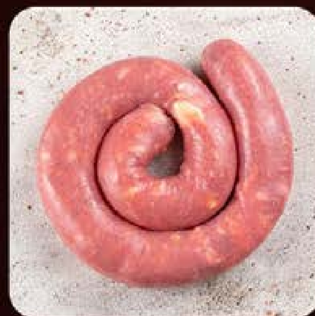
Linguíça de Pernil com Provolone Swift