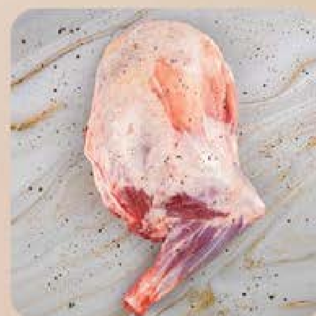
Paleta de Cordeiro da Patagônia Swift