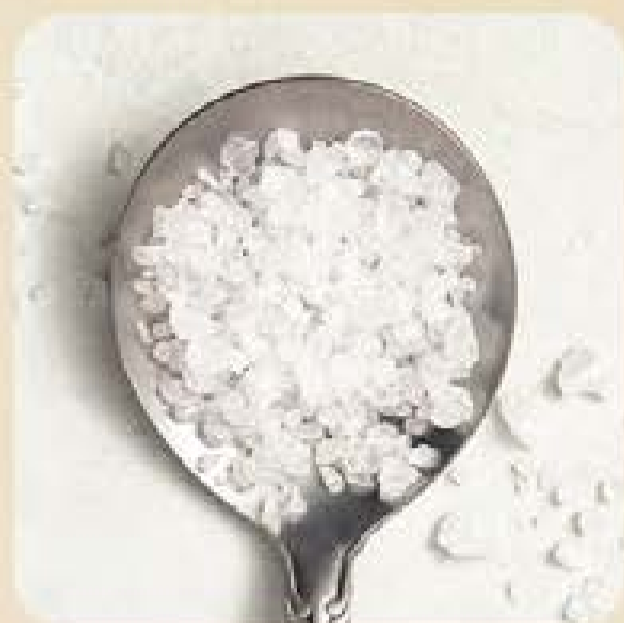
Sal Grosso Swift

A Swift tem qualidade até na hora de temperar. São diversas opções para você finalizar suas receitas com muito mais sabor.