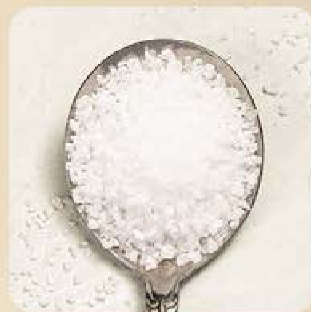
Sal de Parrilha Swift