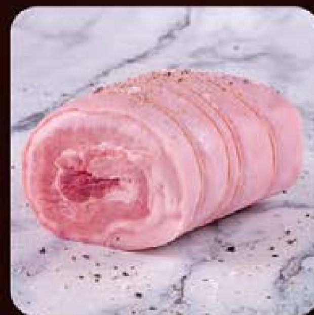
Porchetta Premium Swift