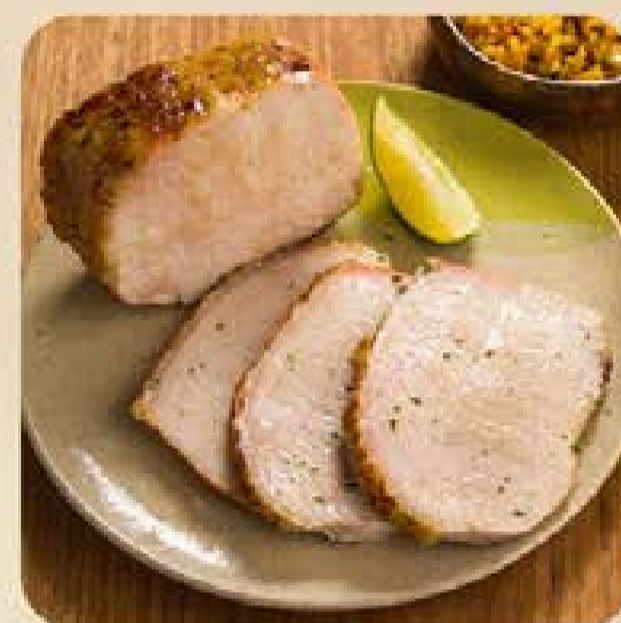
Lombo Suíno Já Pro Forno Swift