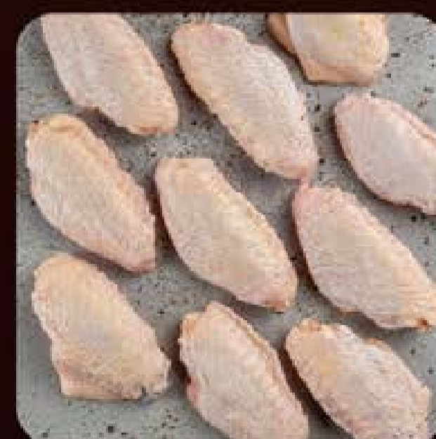
Meio da Asa (tulipa) Swift