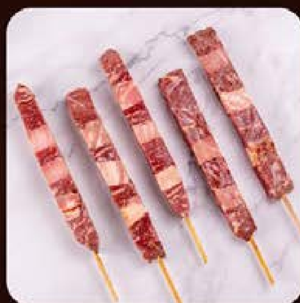
Espetinho Bovino com Bacon Swift