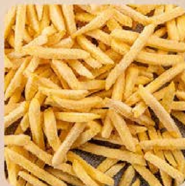
Batata Airfryer Extra Croc McCain