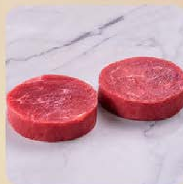
Medalhão Bovino Swift