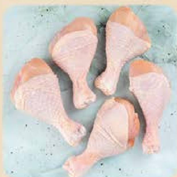
Coxa de Frango Orgânico Seara

A qualidade que você já conhece, com a praticidade que você não pode perder. Aproveite os nossos lançamentos e leve mais sabor para o seu cardápio.