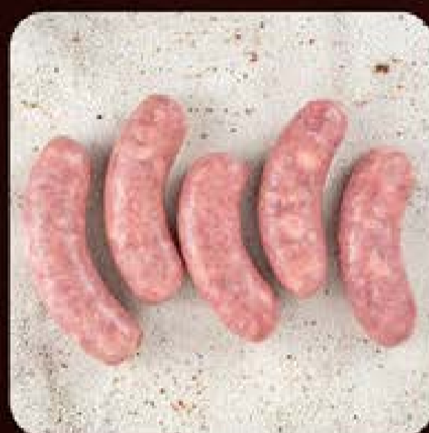
Linguíça de Pernil Swift