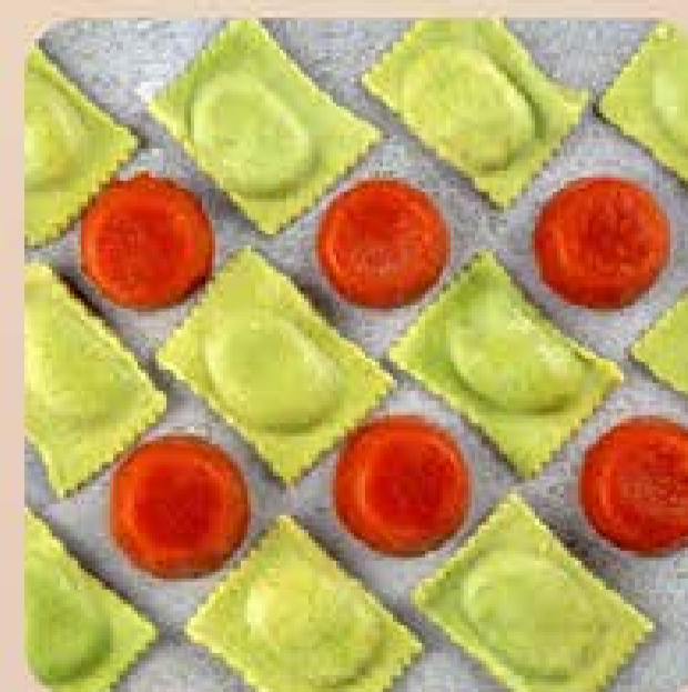
Ravióli com Mussarela de Búfala ao Molho Pomodoro Swift