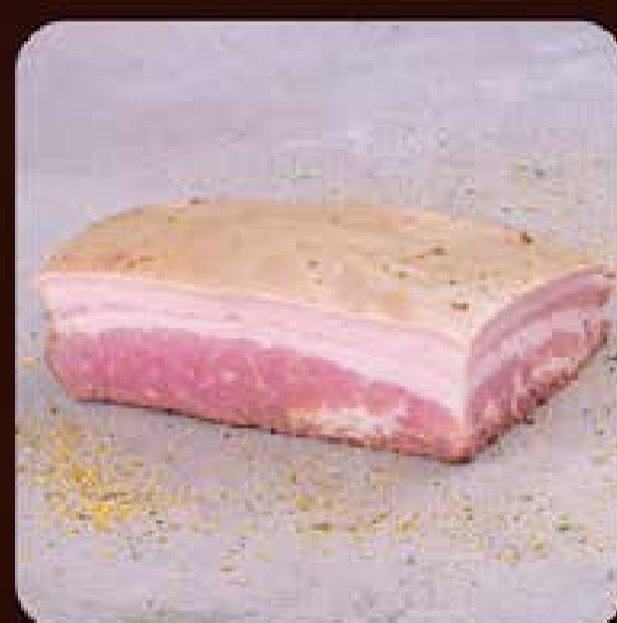
Panceta Suína Lemon Pepper Swift