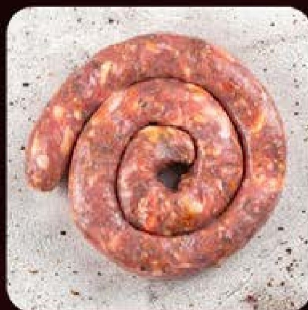
Linguíça de Pernil com Queijo Coalho Swift