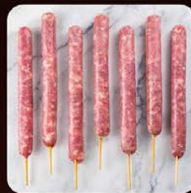
Espetinho de Linguiça Swift