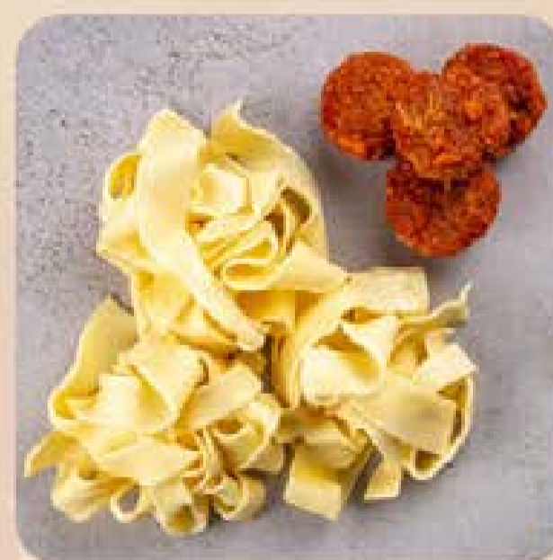
Pappardelle com Ragu de Costela Swift