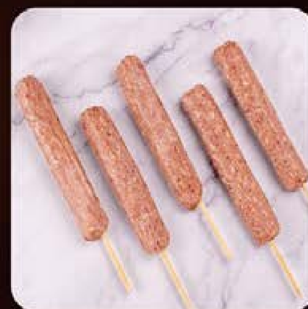
Espetinho de Kafta Swift