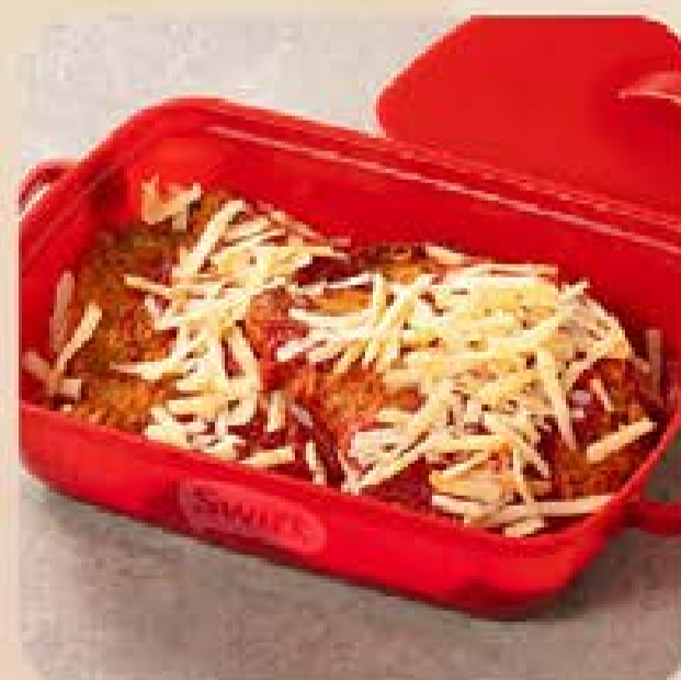
Bife à Parmegiana Swift