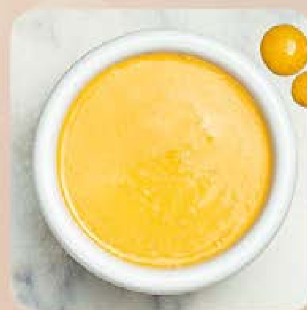
Pimenta Cremosa Swift