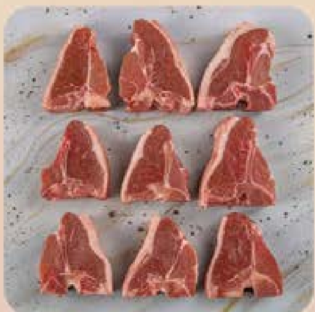
T-Bone de Cordeiro da Patagônia Swift