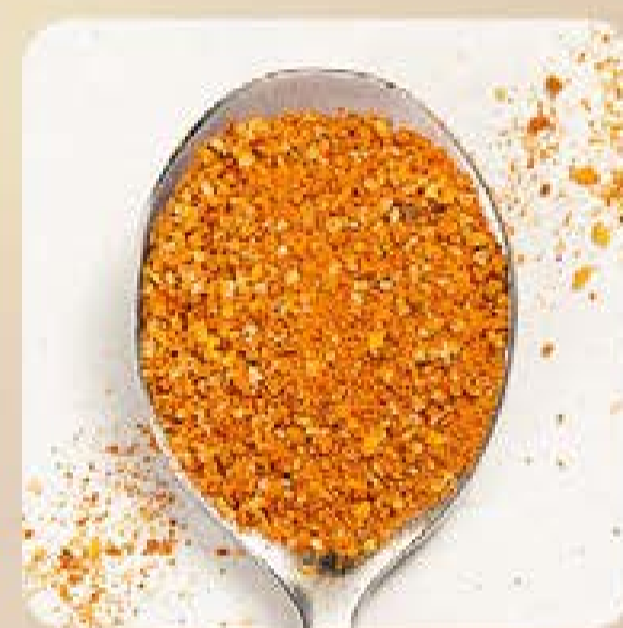
Dry Rub Bovino Swift