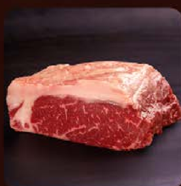
Bife de Chorizo Black Swift