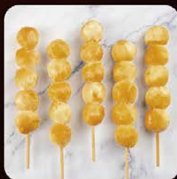
Espetinho de Queijo Mussarela Defumado Swift