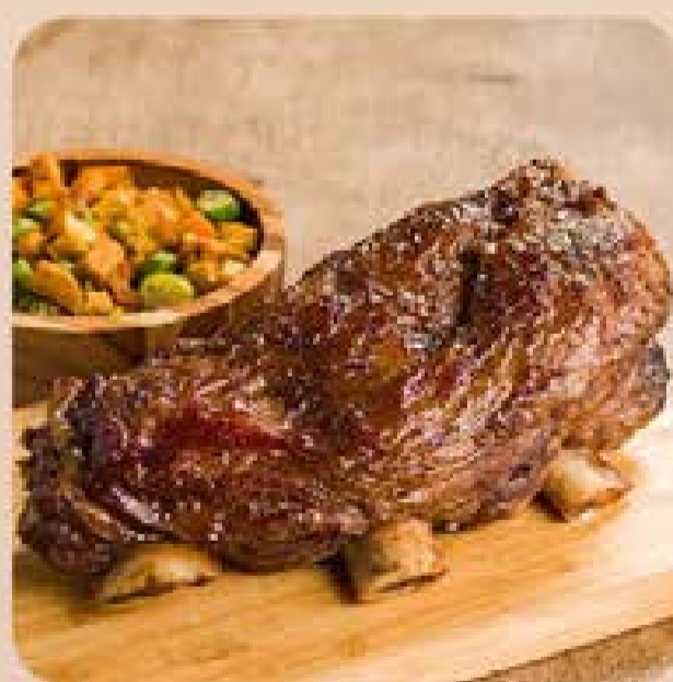
Costela Bovina Já Pro Forno Swift