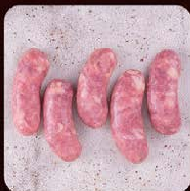
Linguíça Toscana Swift