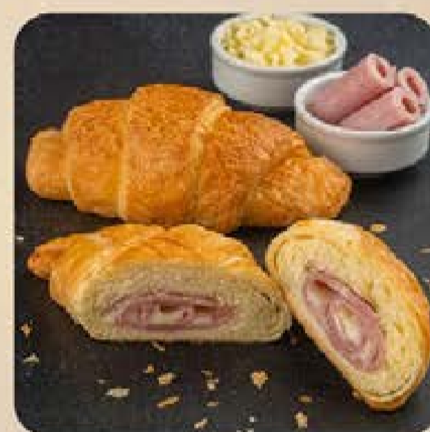
Croissant de Presunto e Queijo Swift