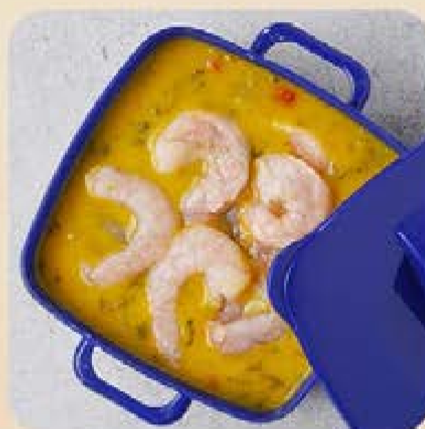
Bobó de Camarão Swift