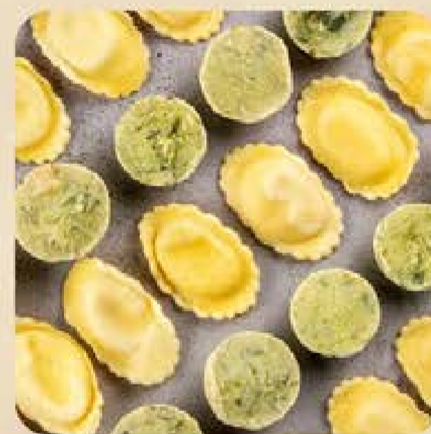
Ravióli ao Molho de Alho-Poró Swift