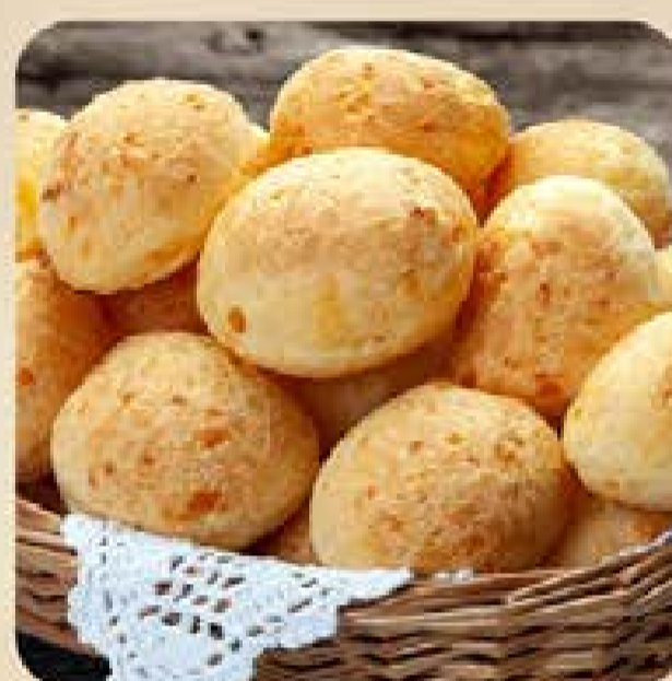
Pão de Queijo Swift