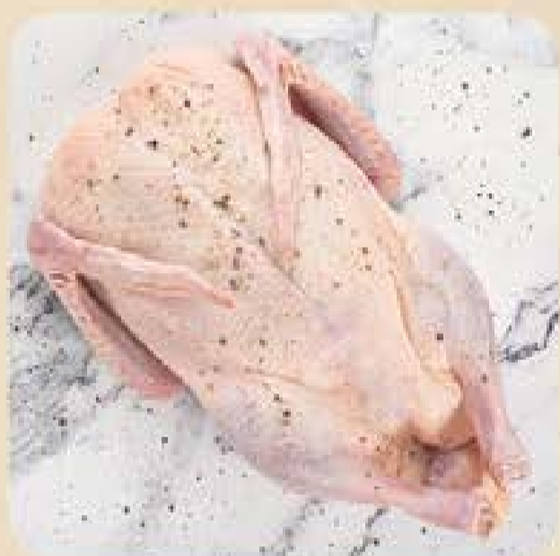
Pato Inteiro Swift