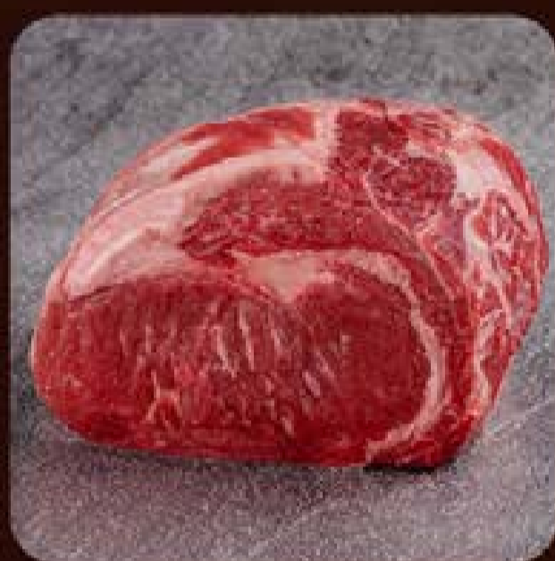
Bife Ancho Gran Reserva Swift