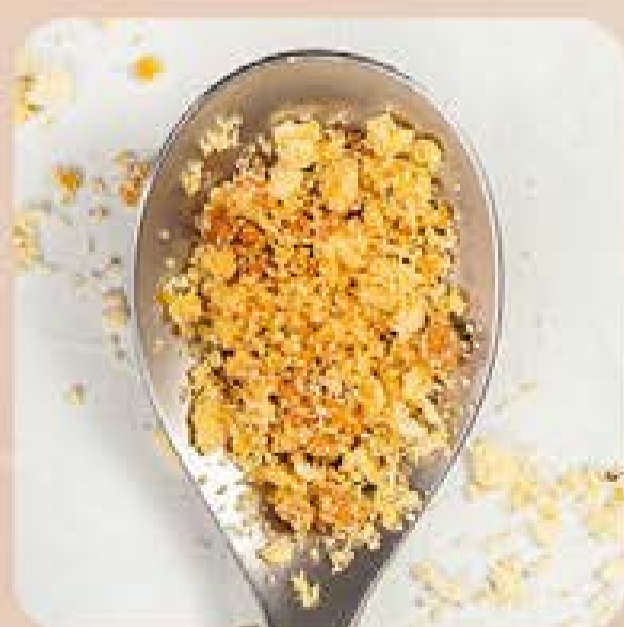
Farofa Tradicional Swift