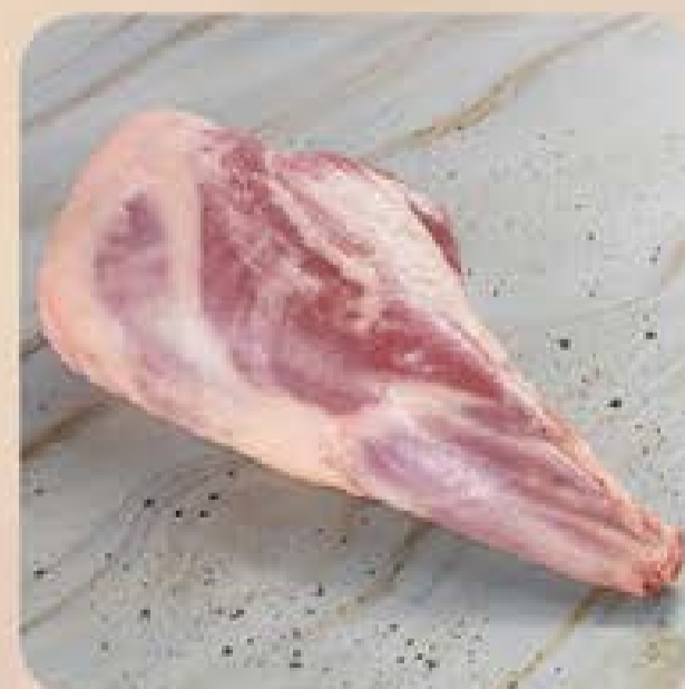
Pernil de Cordeiro da Patagônia Swift