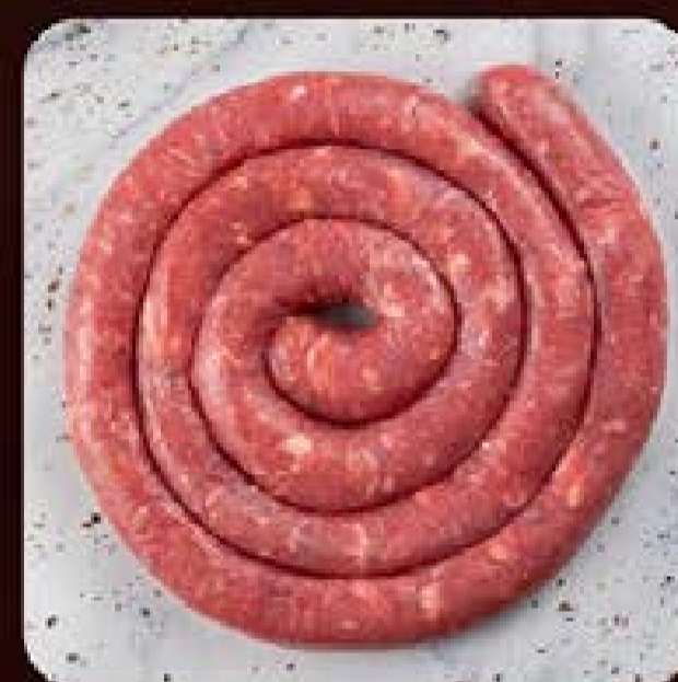
Linguíça de Lombo Fina Swift