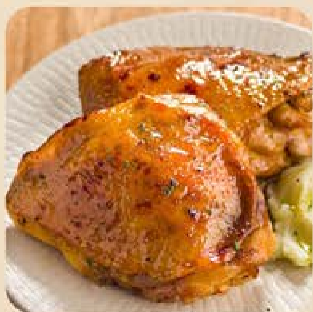
Sobrecoxa Temperada Já Pro Forno Swift