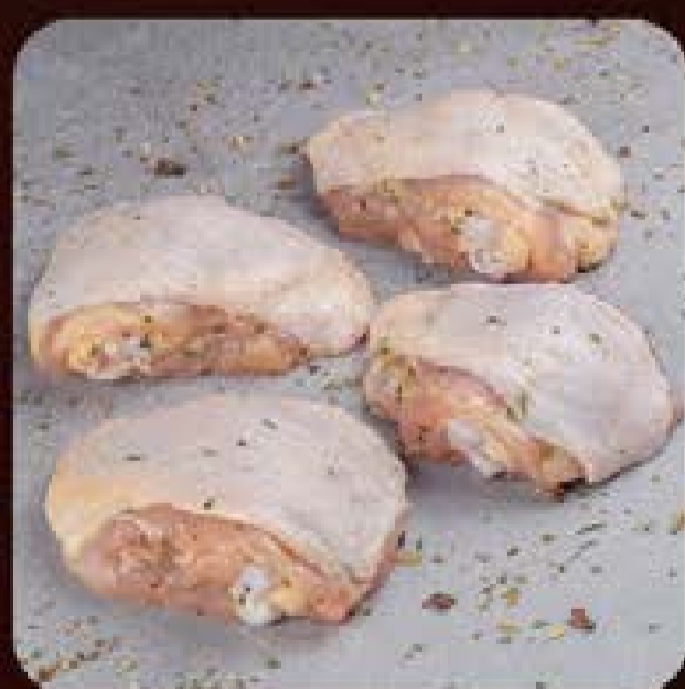
Sobrecoxa Temperada Swift