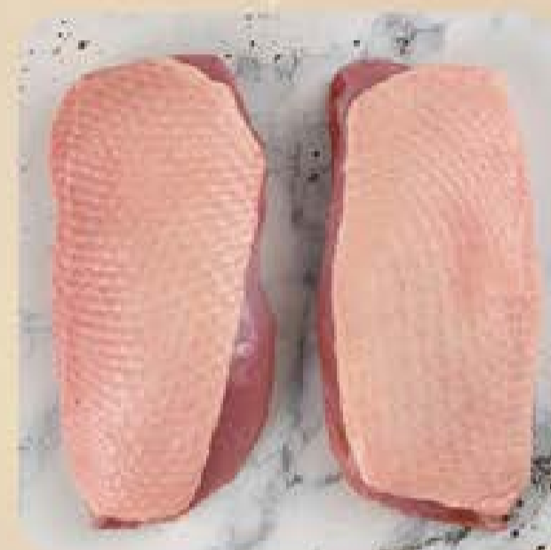
Peito de Pato Swift