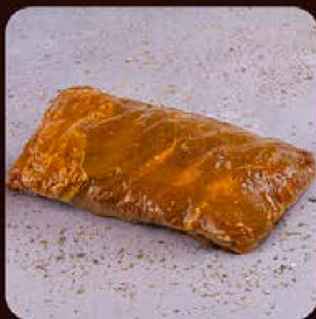
Costela Suína Temperada com Molho Barbecue South Caroline Swift