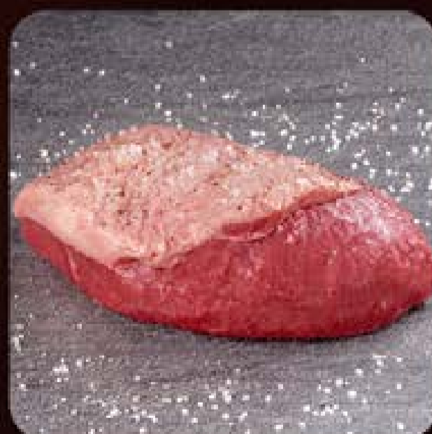
Baby Beef Gran Reserva Swift