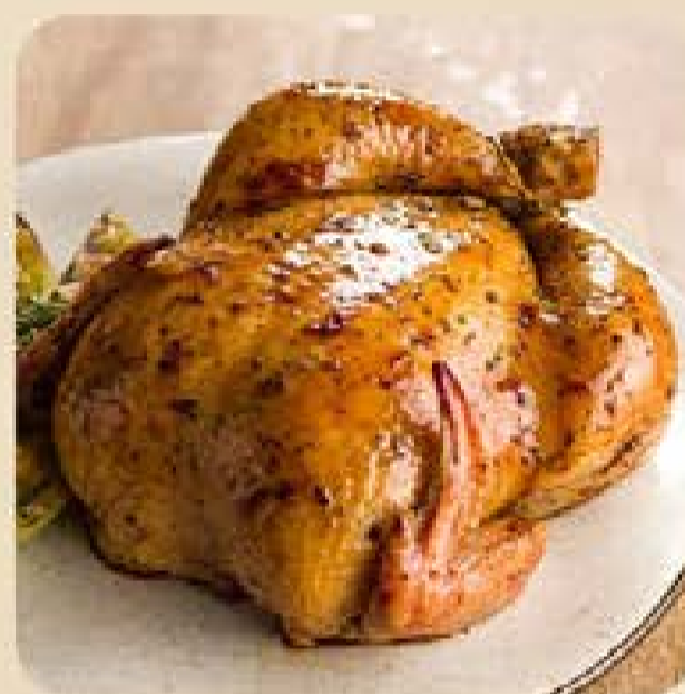
Frango Temperado Já Pro Forno Swift