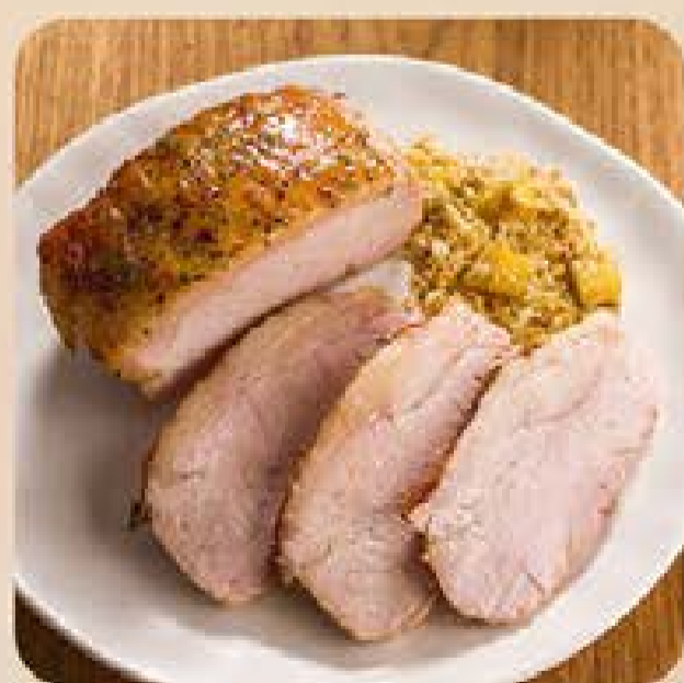
Pernil Suíno Já Pro Forno Swift