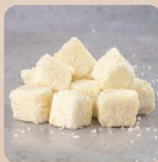
Dadinhos de Tapioca Swift