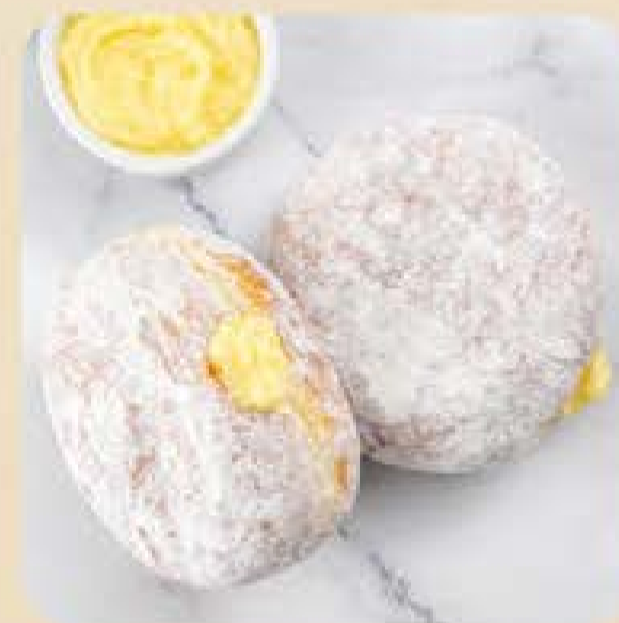
Donuts com Recheio de Creme Swift