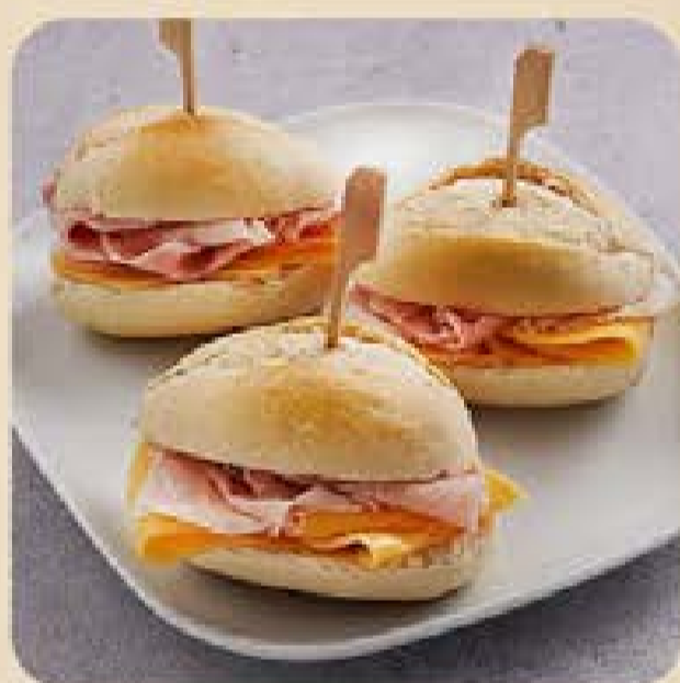
Mini Pão Francês Swift