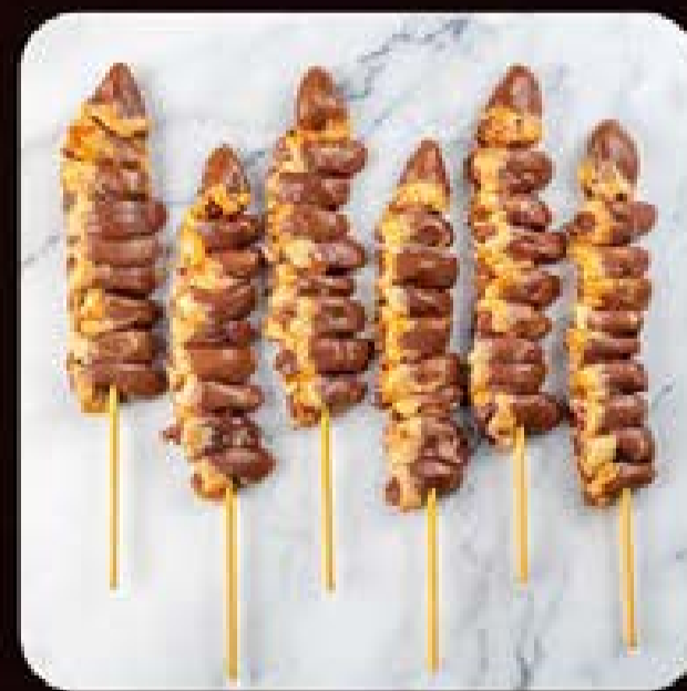
Espetinho de Coração Swift