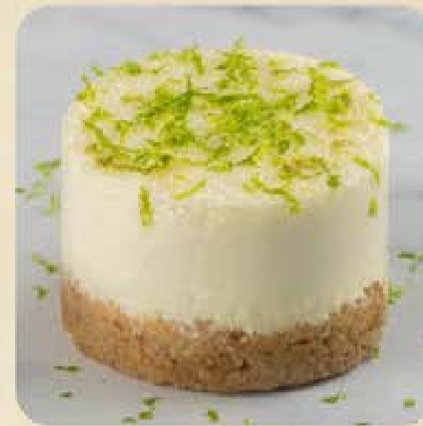
Mini Torta de Limão Swift