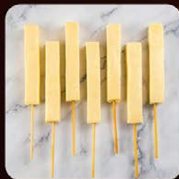
Espetinho de Queijo Coalho Swift