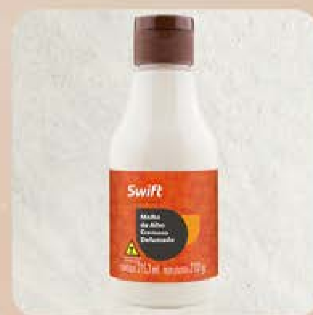
Molho de Alho Cremoso Defumado Swift