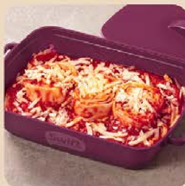
Rondelli de Presunto e Queijo com Molho Sugo Swift