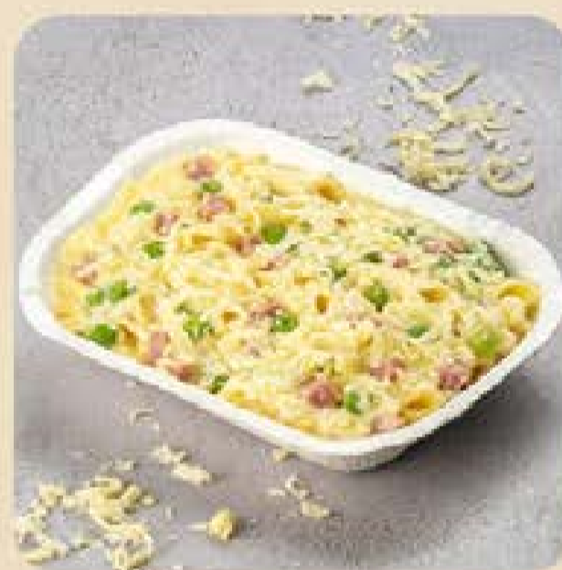
Penne ao Molho Parisiense Swift