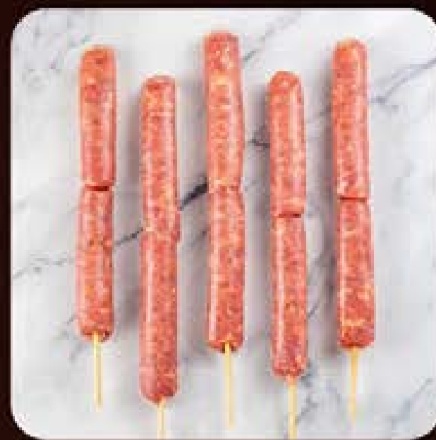
Espetinho de Linguiça Apimentada Swift