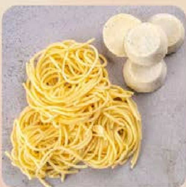
Espaguete Cacio e Pepe Swift