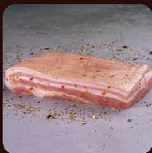
Panceta Suína Temperada Swift