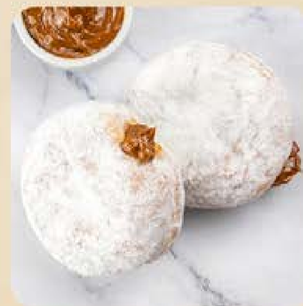
Donuts com Recheio de Doce de Leite Swift