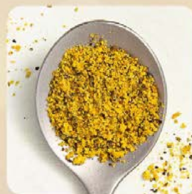
Lemon Pepper Swift