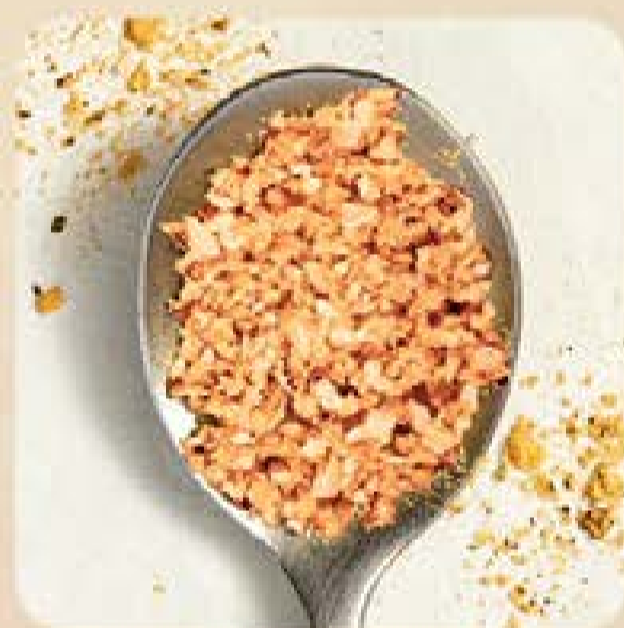
Alho Frito Swift