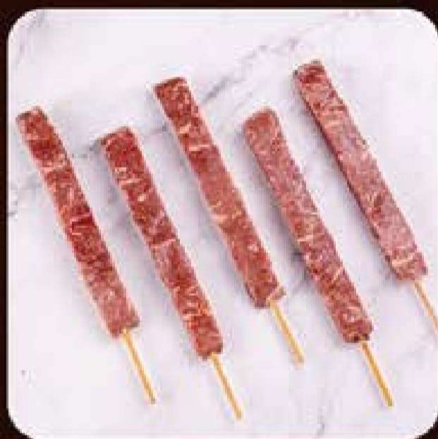
Espetinho Bovino Swift