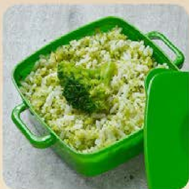
Arroz com Brócolis PP Swift