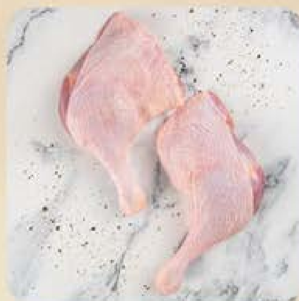
Coxa e Sobrecoxa de Pato Swift