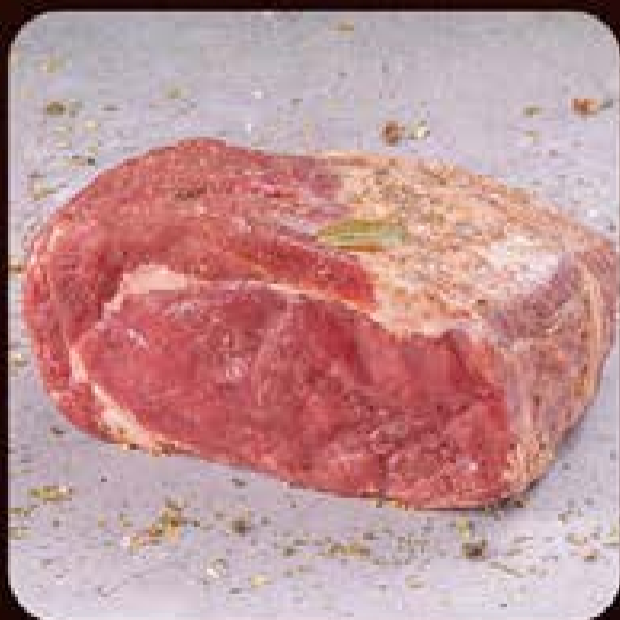
Ancho com Chimichurri Swift