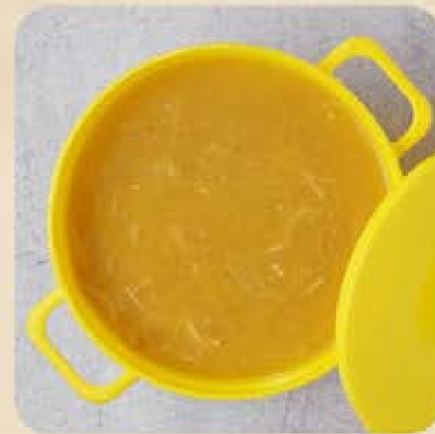
Caldo de Mandioquinha com Frango Swift