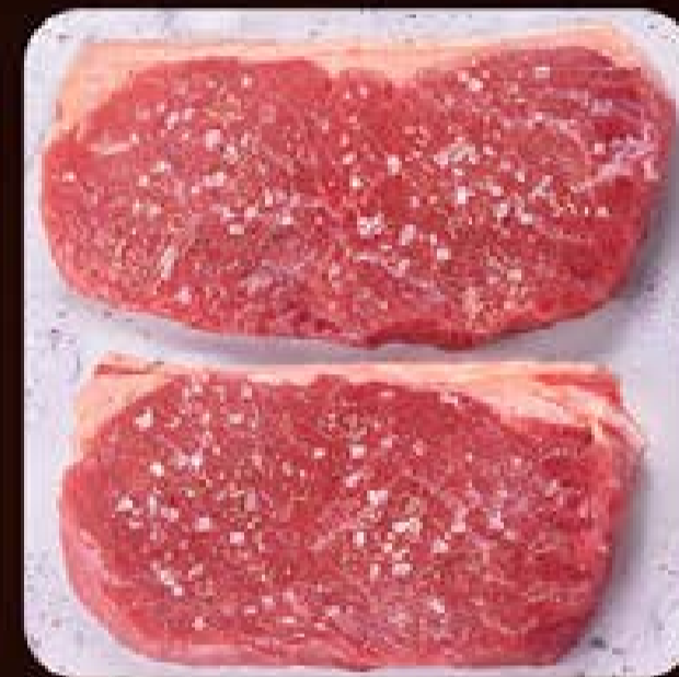
Bife de Chorizo Swift