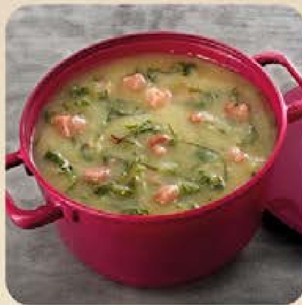
Caldo Verde com Fios de Couve Swift