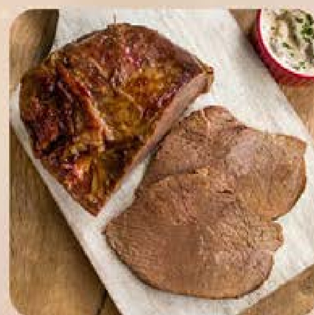
Alcatra Já Pro Forno Swift