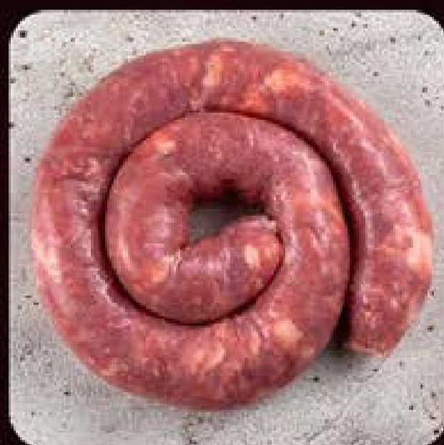
Linguíça Suína com Pimenta Biquinho Swift