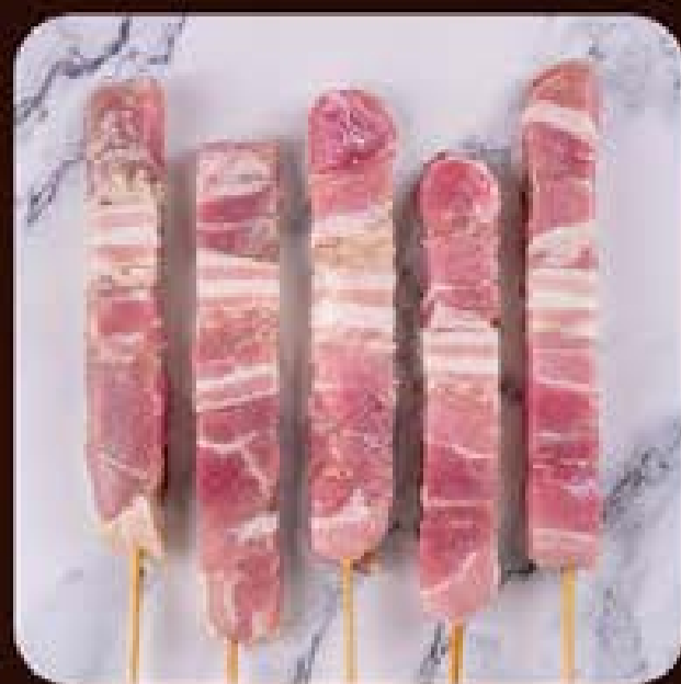
Espetinho de Panceta Swift