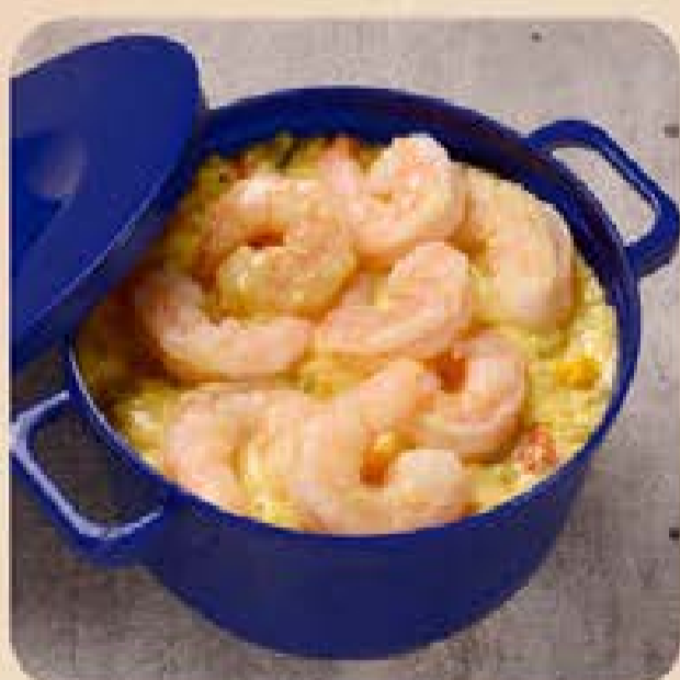
Arroz Cremoso com Camarão Swift