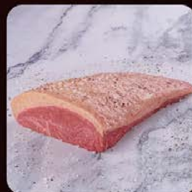
Picanha Nobre Ouro Swift