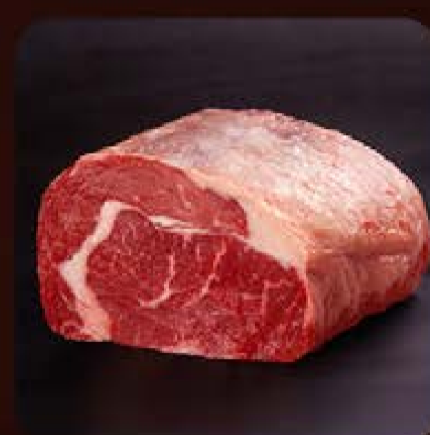
Bife Ancho Black Swift