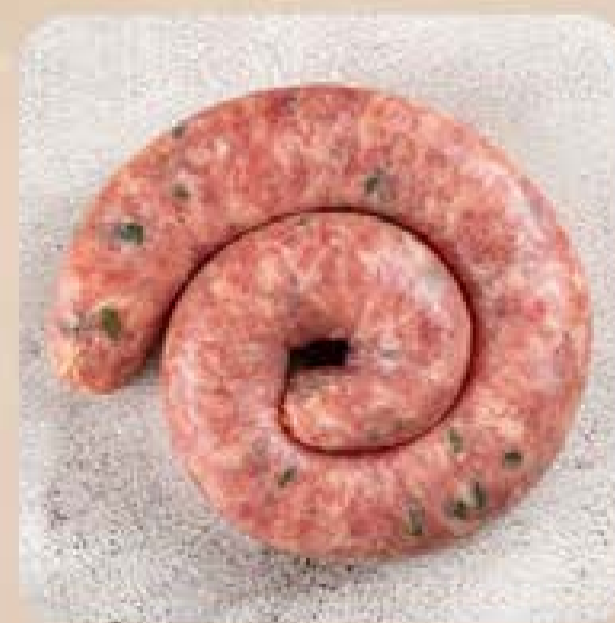
Linguiça Suína com Mandioca e Bacon Swift