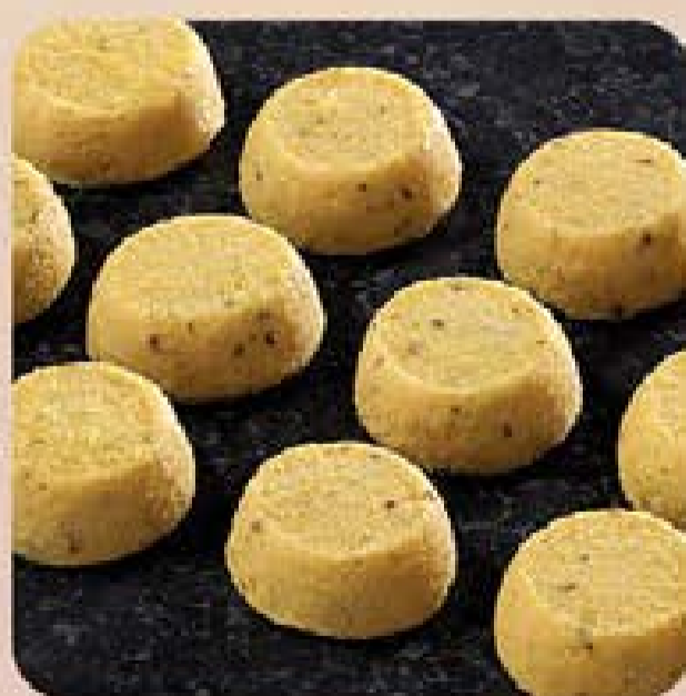
Broa de Milho com Erva Doce Swift