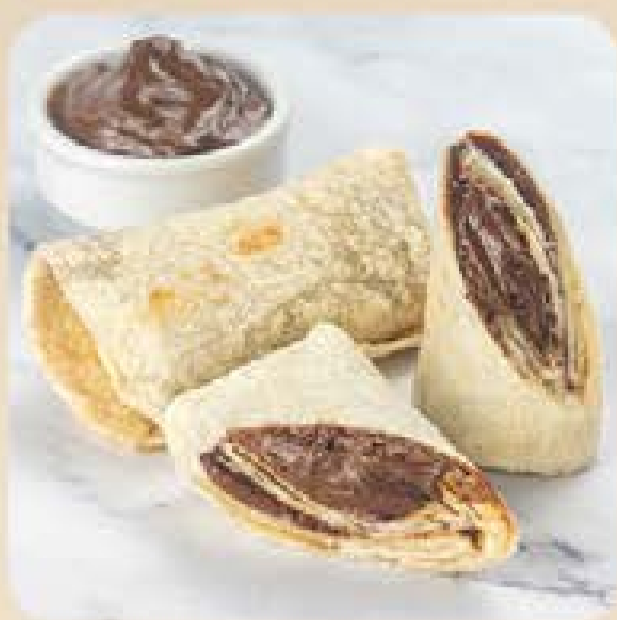
Burrito de Creme de Avelã Swift