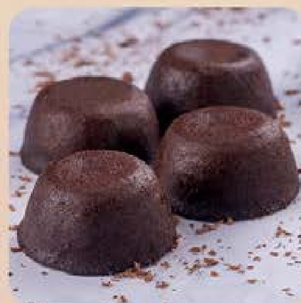
Petit Gâteau de Chocolate Swift