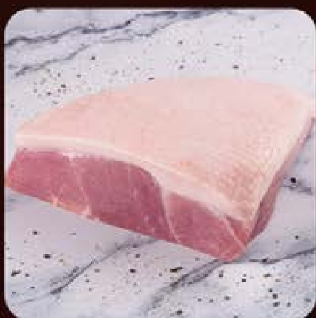
Picanha Suína Porcionada Seara