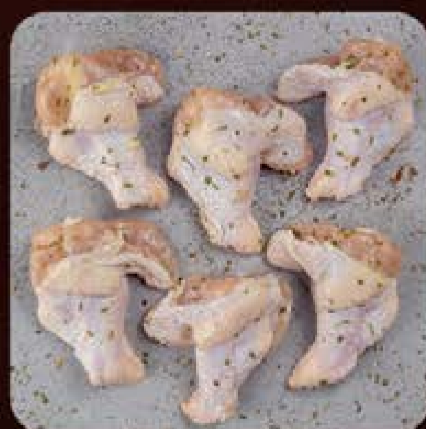
Coxinha da Asa Temperada Swift