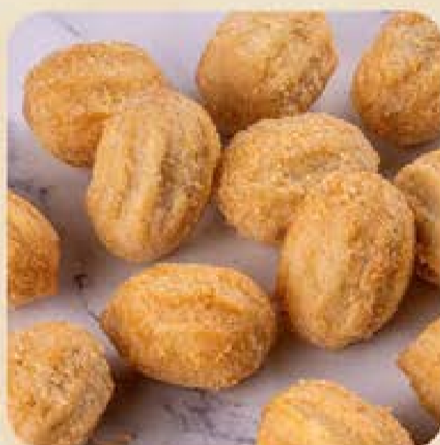
Mini Churros Recheados com Doce de Leite Swift