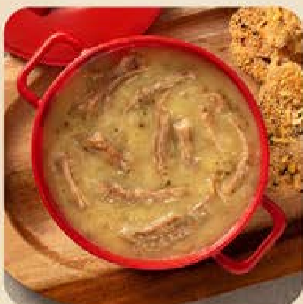
Caldo de Mandioca com Costela Swift