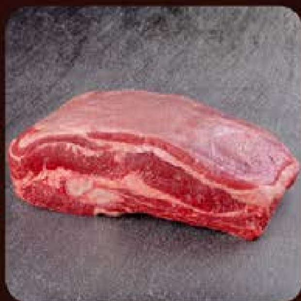
Costela Bafo Gran Reserva Swift