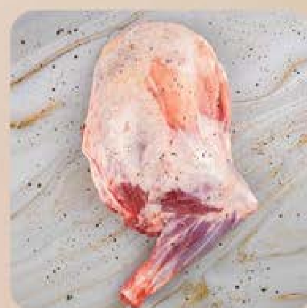
Paleta de Cordeiro da Patagônia Swift