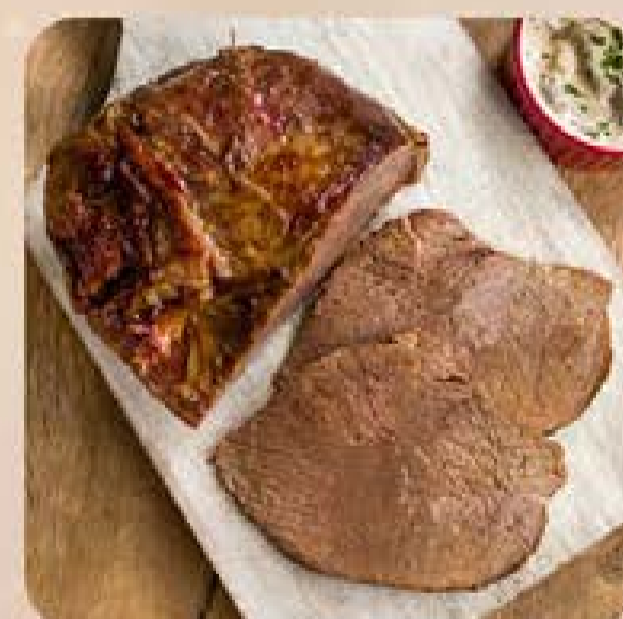
Alcatra Já Pro Forno Swift