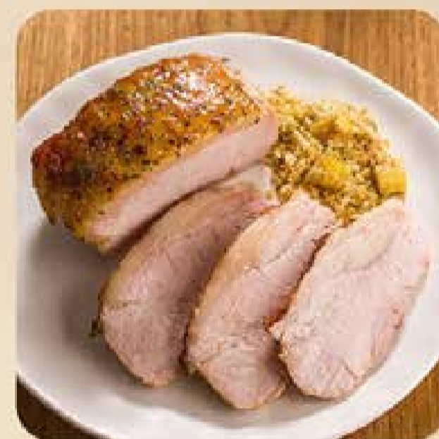
Pernil Suíno Já Pro Forno Swift