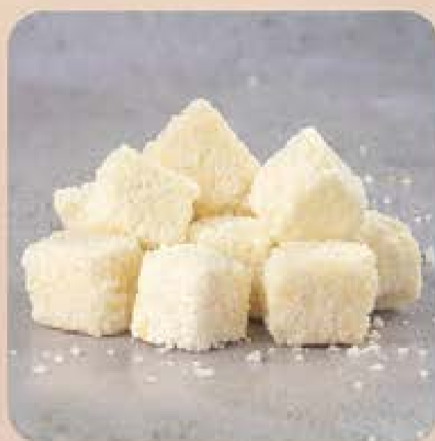
Dadinhos de Tapioca Swift