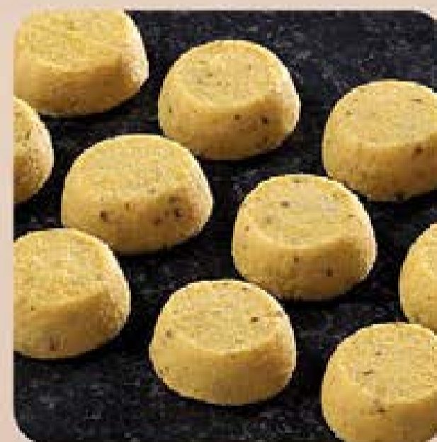
Broa de Milho com Erva Doce Swift