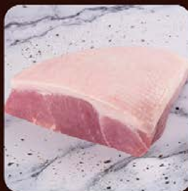
Picanha Suína Porcionada Seara