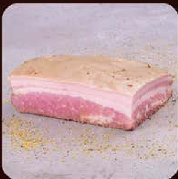
Panceta Suína Lemon Pepper Swift