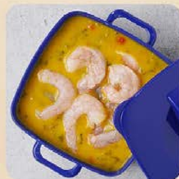
Bobó de Camarão Swift