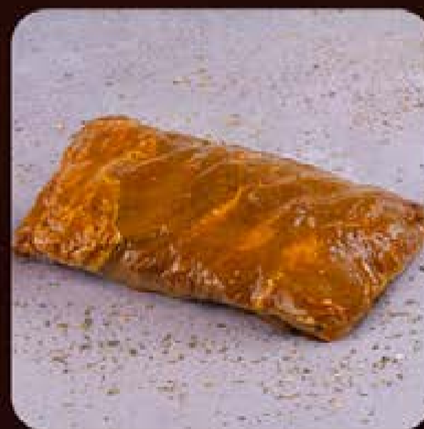
Costela Suína Temperada com Molho Barbecue South Caroline Swift