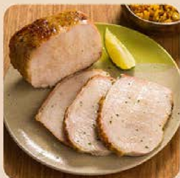
Lombo Suíno Já Pro Forno Swift