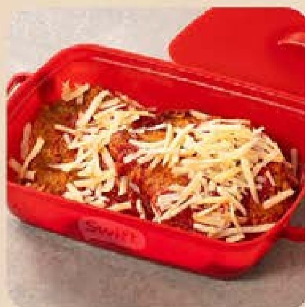
Bife à Parmegiana Swift