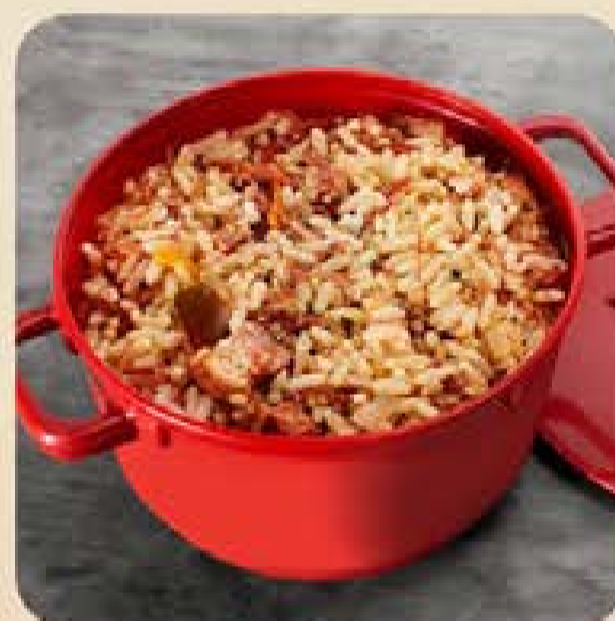
Arroz Carreteiro Swift