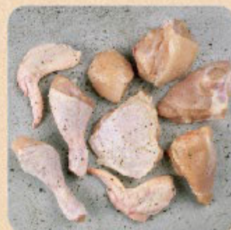
Frango a Passarinho Swift