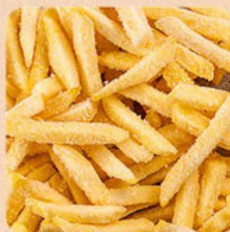
Batata para Air Fryer Extra Croc McCain