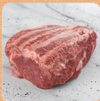
Acém Swift Combo

Nossa linha de produtos congelados individualmente vão do freezer direto para a panela , sem precisar descongelar. Eles ficam soltinhos na embalagem, você retira somente o que for consumir, sem desperdício.