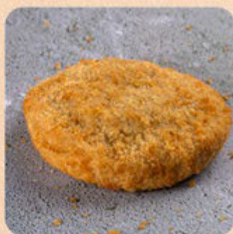
Empanado Presunto e Queijo Swift

Com essa praticidade fica fácil preparar um petisco novo na hora que bater aquela vontade. O difícil vai ser não se apaixonar pela crocância e qualidade.