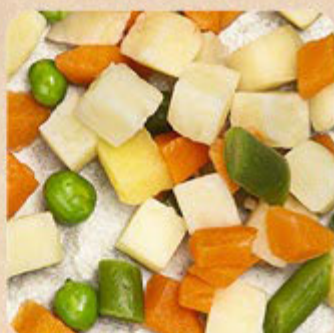
Mistura de 4 Legumes Swift