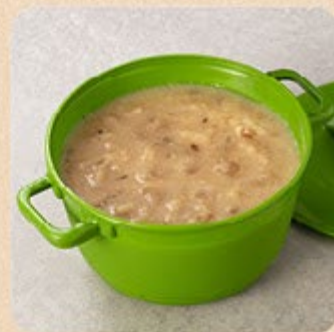
Creme de Cebola Swift