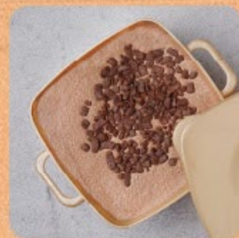
Bolo Mousse de Brigadeiro Swift