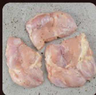
Filé de Sobrecoxa Swift