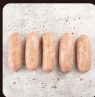
Linguiça de Frango Swift