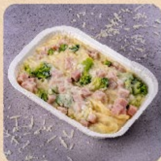
Fettuccine com Peito de Peru e Brócolis Swift