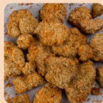
Iscas de Frango Swift