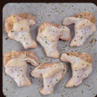
Coxinha da Asa Temperada Swift

Nossa tecnologia exclusiva de ultracongelamento rápido na origem é o que faz toda a diferença e garante um alimento seguro, com todos os nutrientes, textura e sabor preservados.