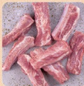
Costelinha a Passarinho Temperada Swift