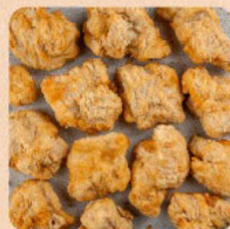
Frango Karaague Empanado Swift