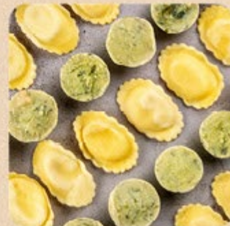
Ravióli ao Molho de Alho-Poró Swift