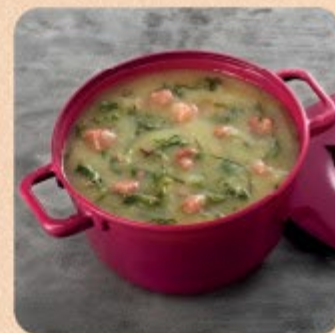
Caldo Verde com Fios de Couve Swift