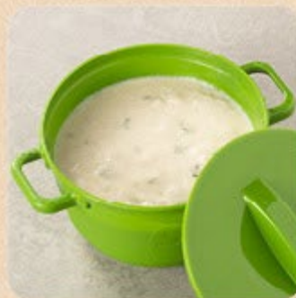
Creme de Palmito Swift