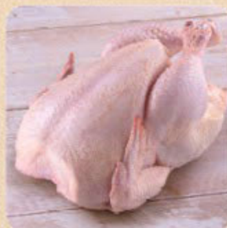
Frango Inteiro Swift do Campo