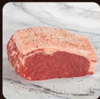
Contra Filé Combo Swift