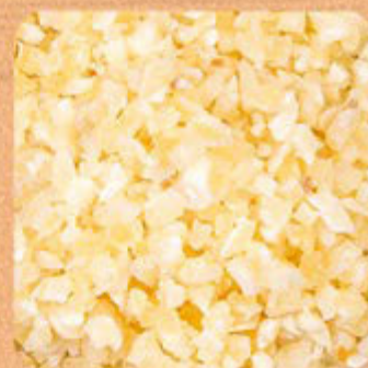
Alho Picado Swift