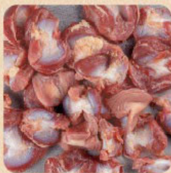
Moela Bandeja Swift