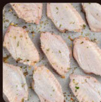
Meio da Asa (Tulipa) Temperada Swift