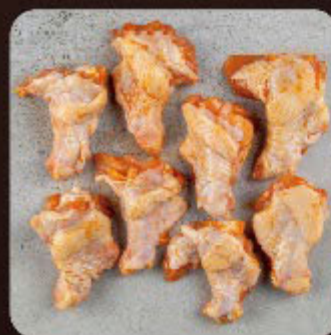
Coxinha da Asa Buffalo Wings Swift