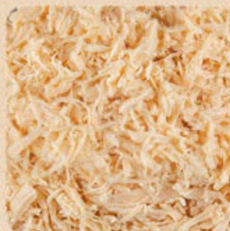
Peito de Frango Desfiado Swift