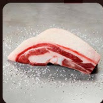
Costela no Bafo Swift

Os cortes Swift passam por um processo de maturação em que a carne é mantida em ambiente com temperatura controlada, deixando-a mais macia e saborosa e perfeita para o seu churrasco!