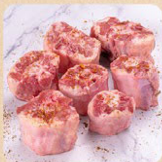
Rabo Bovino Swift