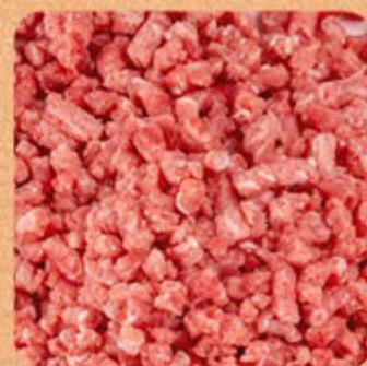
Carne Moída de Patinho Swift