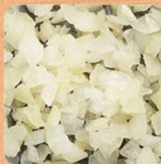
Cebola Picada Swift