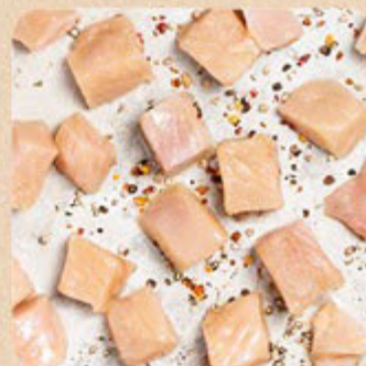
Filé de Peito em Cubos Swift Mais