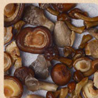
Mix de Cogumelos Swift