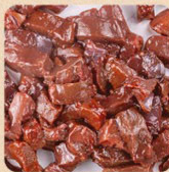
Isclas de Fígado Swift