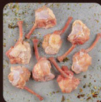
Tulipa Invertida Temperada Swift