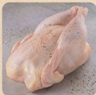
Galinha Inteira Swift