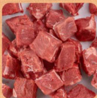
Cubos para Panela Swift