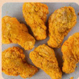
Coxinha da Asa Empanada Seara