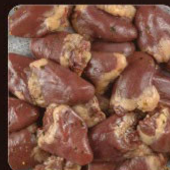
Coração com Ervas Finas Swift