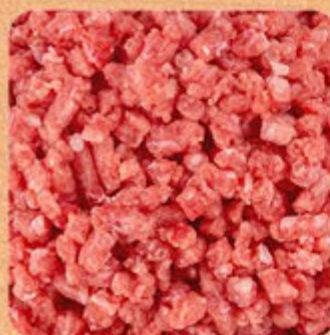
Carne Moída Bolonhesa Swift