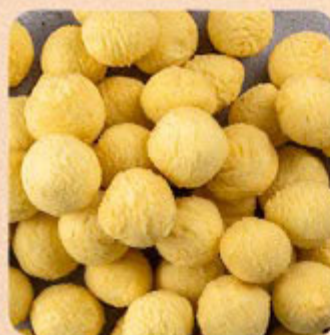
Batata Noisettes Pré-Frita Swift