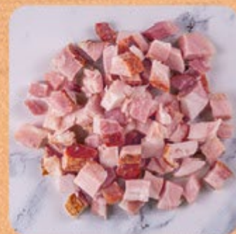
Bacon em Cubos Swift