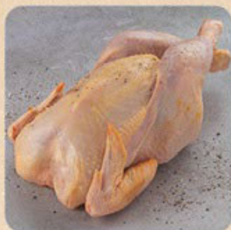
Frango Caipira Swift