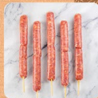
Espetinho de Linguiça Apimentada Swift