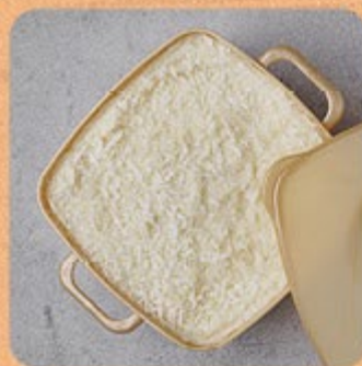
Bolo Gelado de Coco Swift