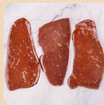
Bife de Fígado Swift