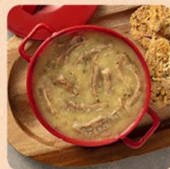
Caldo de Mandioca com Costela Swift