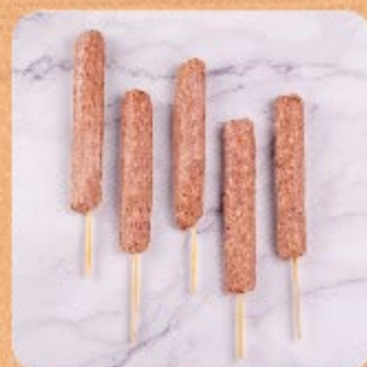
Espetinho de Kafta Swift