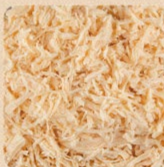
Peito de Frango Desfiado Swift