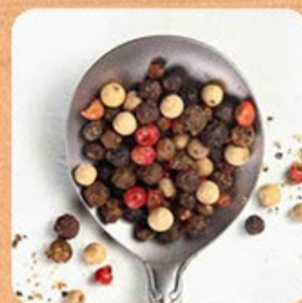
Mix de Pimentas Swift