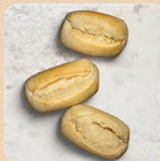
Pão Francês Swift