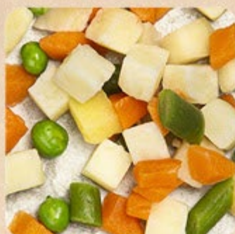
Mistura de 4 Legumes Swift