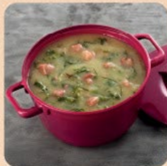
Caldo Verde com Fios de Couve Swift