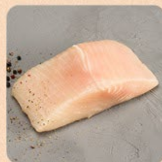
Lombo de Pirarucu Swift