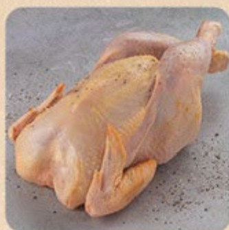
Frango Caipira Swift