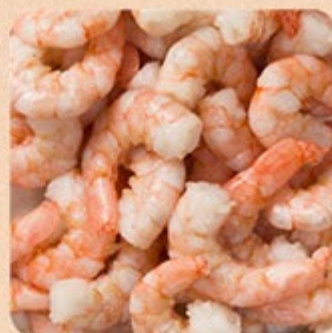
Camarão Sem Cabeça Descascado Pré- Cozido 71/90 Swift