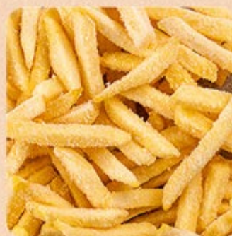
Batata para Air Fryer Extra Croc McCain