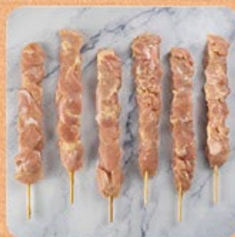
Espetinho de Linguiça Apimentada Swift