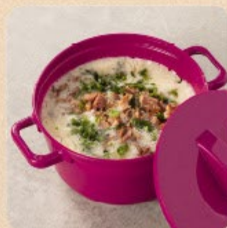
Caldo de Batata com Bacon Swift