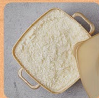
Bolo Gelado de Coco Swift