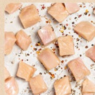
Filé de Peito em Cubos Swift Mais