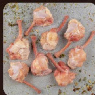
Tulipa Invertida Temperada Swift