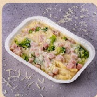
Fettuccine com Peito de Peru e Brócolis Swift

Nossas massas são extremamente práticas, para que você gaste menos tempo na cozinha e mais tempo aproveitando! A facilidade vem acompanhada de ingredientes selecionados que dão aquele sabor autêntico de receita de família.