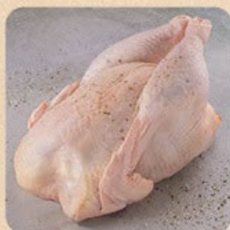
Galinha Inteira Swift