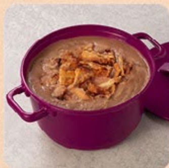
Caldo de Feijão Swift

A temperatura caiu, mas os sabores das panelinhas estão em alta. Deixe essa estação ainda mais deliciosa e quentinha com nossas opções de caldos e cremes, todos sem conservantes, com toda a qualidade que você procura.