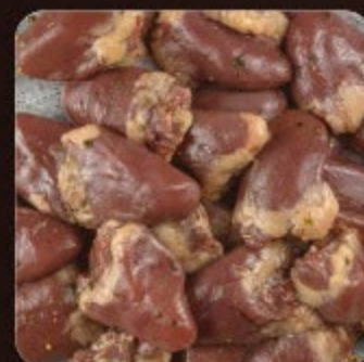
Coração com Ervas Finas Swift