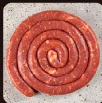
Linguiça Calabresa Apimentada Swift