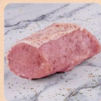
Lombo Suíno Temperado Swift