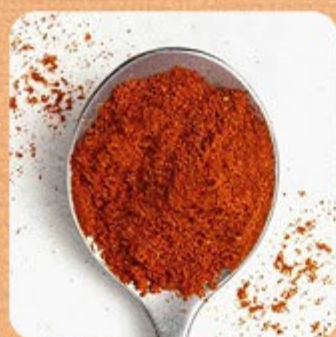
Páprica Picante Swift