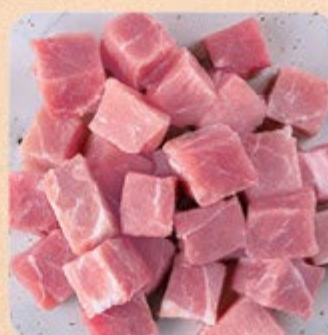
Cubos de Pernil Suíno Swift