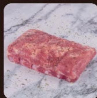
Costela Suína Temperada Swift