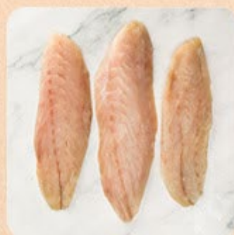
Filé de Pescada Swift