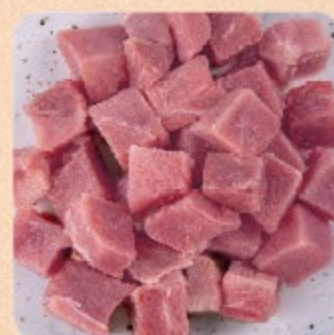
Cubos de Filé-Mignon Suíno Swift