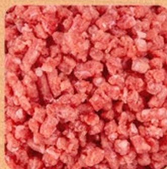
Carne Moída Bolonhesa Swift