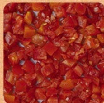
Tomate Picado Swift