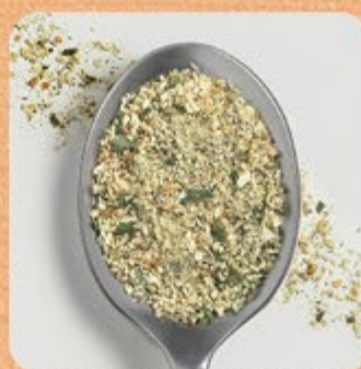
Cebola, Alho e Salsa Swift