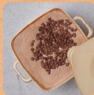
Bolo Mousse de Brigadeiro Swift