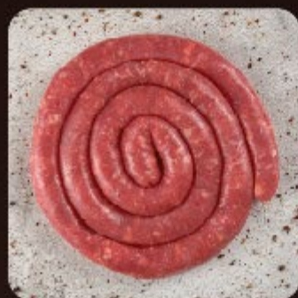
Linguiça Toscana Fina Swift