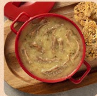
Caldo de Mandioca com Costela Swift