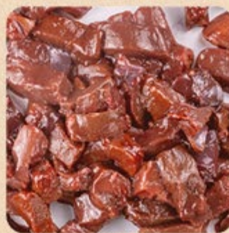
Isclas de Fígado Swift