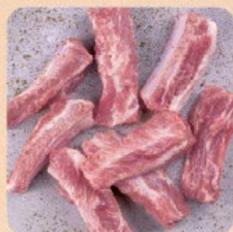
Costelinha a Passarinho Temperada Swift