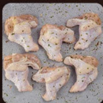
Coxinha da Asa Temperada Swift

Nossa tecnologia exclusiva de ultracongelamento rápido na origem é o que faz toda a diferença e garante um alimento seguro, com todos os nutrientes, textura e sabor preservados.