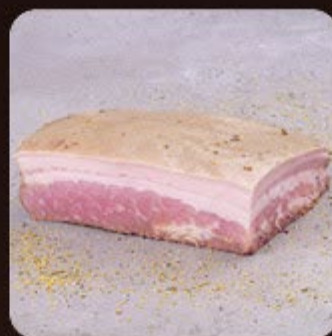
Panceta Suína Lemon Pepper Swift