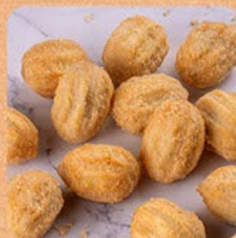
Mini Churros Recheados com Doce de Leite Fritos Swift