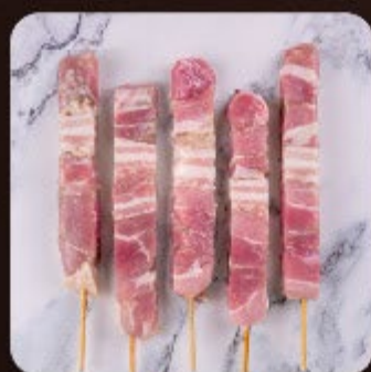
Espetinho de Panceta Swift