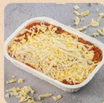
Lasanha Bolonhesa Swift