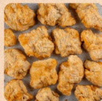
Frango Karaague Empanado Swift