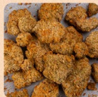
Isclas de Frango Swift