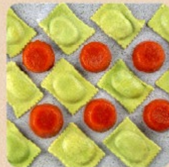
Ravióli com Mussarela de Búfala ao Molho Pomodoro Swift