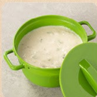
Creme de Palmito Swift