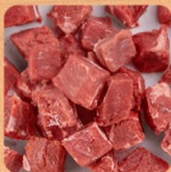
Cubos para Panela Swift