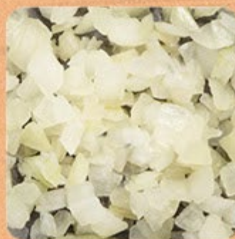
Cebola Picada Swift