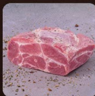
Copa Lombo Suína Temperada Swift