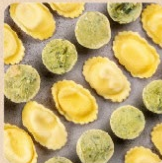
Ravióli ao Molho de Alho-Poró Swift