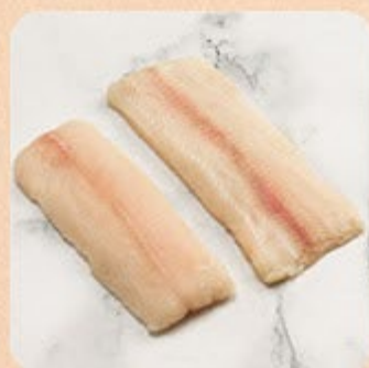
Filé de Mapará Swift