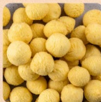
Batata Noisettes Pré-Frita Swift