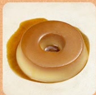
Pudim de Leite Swift

As sobremesas Swift são feitas com ingredientes selecionados para você preparar em minutos, mas pode saborear bem devagar.