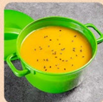
Caldo de Abóbora com Leite de Coco e Gengibre Swift