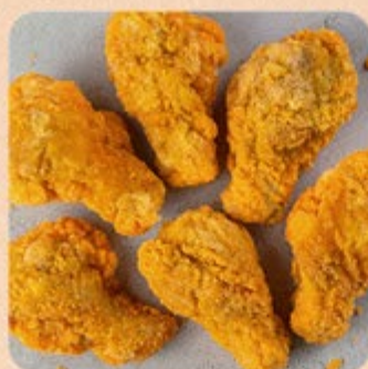
Coxinha da Asa Empanada Seara