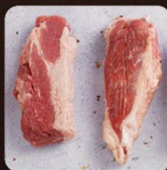
Capa de Filé Swift