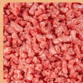
Carne Moída de Patinho Swift