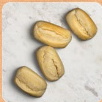
Pão Francês Swift