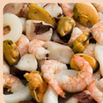
Kit Paella (Lula, Camarões e Mexilhão Swift