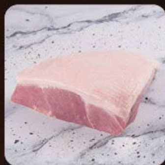
Picanha Suína Grill Swift