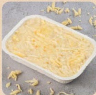
Lasanha 4 Queijos Swift