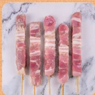
Espetinho de Panceta Swift

Os Espetinhos Swift são feitos com cortes selecionados, já vêm temperados e são superpráticos de preparar.