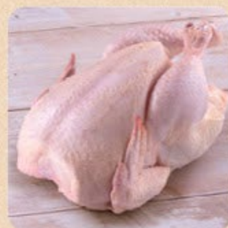
Frango Inteiro Swift do Campo