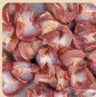
Moela Bandeja Swift