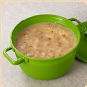
Creme de Cebola Swift