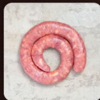
Linguiça de Pernil com Provolone Swift