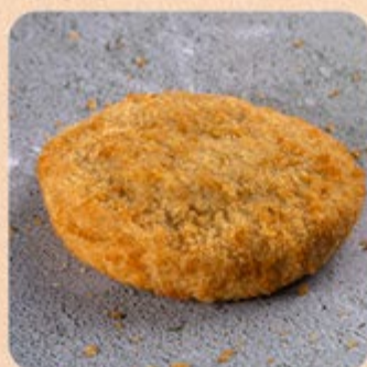
Empanado Presunto e Queijo Swift

Com essa praticidade fica fácil preparar um petisco novo na hora que bater aquela vontade. O difícil vai ser não se apaixonar pela crocância e qualidade.