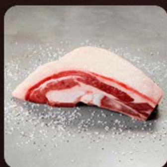
Costela no Bafo Swift

Os cortes Swift passam por um processo de maturação em que a carne é mantida em ambiente com temperatura controlada, deixando-a mais macia e saborosa e perfeita para o seu churrasco!