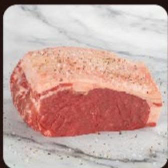
Contra Filé Combo Swift