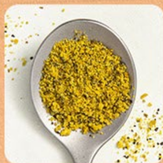
Lemon Pepper Swift