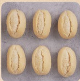
Mini Pão Francês Swift