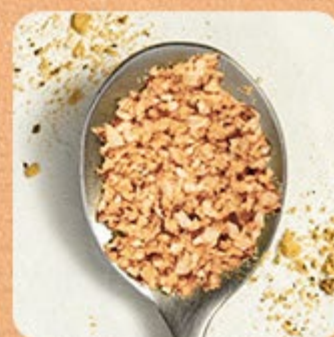
Alho Frito Swift