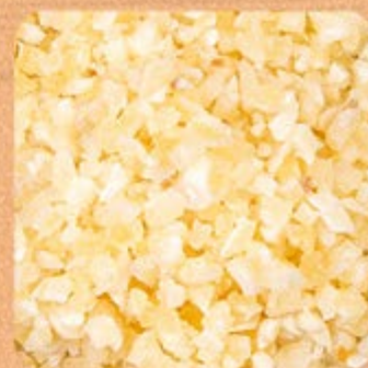
Alho Picado Swift