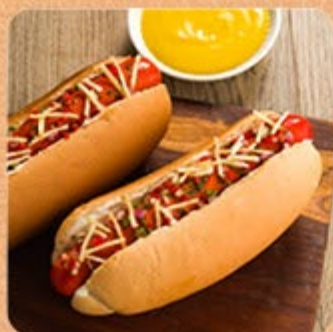
Pão Hot Dog Swift