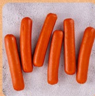
Salsicha Hot Dog Swift