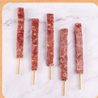
Espetinho Bovino Swift