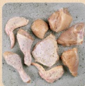
Frango a Passarinho Swift