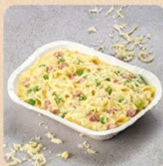
Penne ao Molho Parisiense Swift