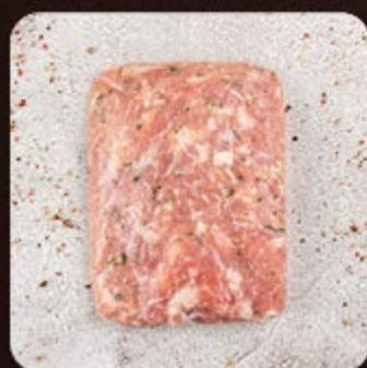
Manta Suína com Queijo Minas Swift

As linguiças Swift tem a versatilidade que você precisa para as entradas, pratos principais, petiscos ou aquele churrasco de respeito. Das mais tradicionais às recheadas.