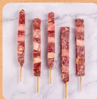
Espetinho Bovino com Bacon Swift