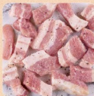
Barriga Aperitivo Seara