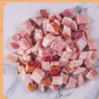
Bacon em Cubos Swift