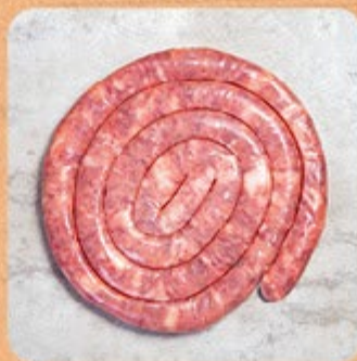
Linguiça Fina de Pernil Apimentada Swift