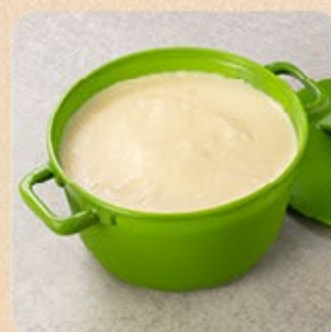
Creme de Queijo Swift