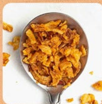
Cebola Crispy Swift