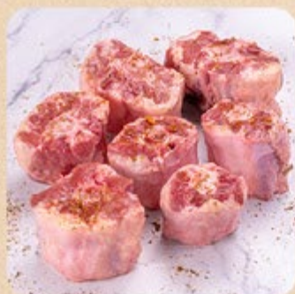
Rabo Bovino Swift