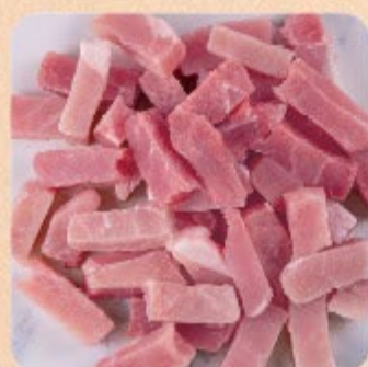
Tiras de Pernil Suíno Swift