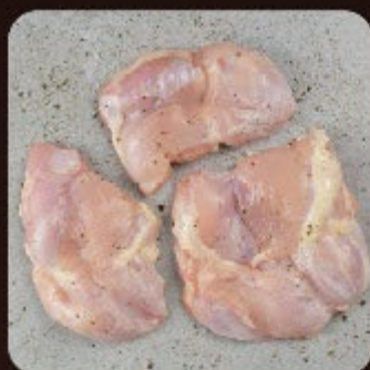
Filé de Sobrecoxa Swift