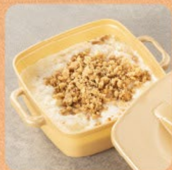
Canjica com Paçoca Swift