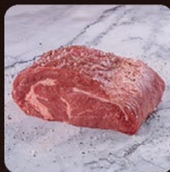
Filé de Costela Noix Swift