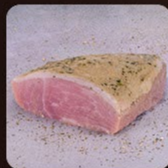
Picanha Suína Com Alho Swift