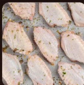
Meio da Asa (Tulipa) Temperada Swift