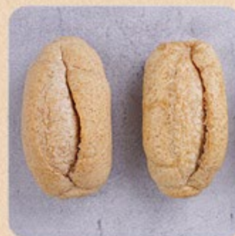
Pão Francês Integral Swift