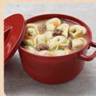
Capeletti de Carne in Brodo Swift