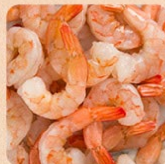
Camarão Descascado Pré-Cozido Eviscerado 36/40 Swift