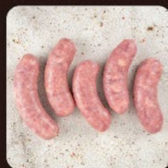
Linguiça de Pernil Swift