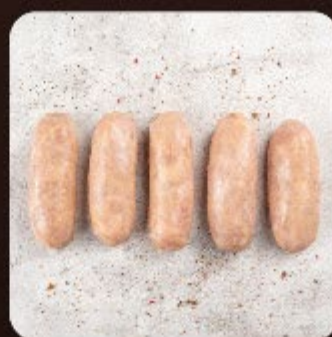
Linguiça de Frango Swift