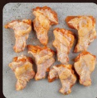
Coxinha da Asa Buffalo Wings Swift