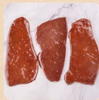
Bife de Fígado Swift