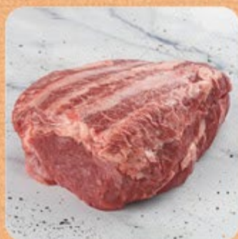
Acém Swift Combo

Nossa linha de produtos congelados individualmente vão do freezer direto para a panela , sem precisar descongelar. Eles ficam soltinhos na embalagem, você retira somente o que for consumir, sem desperdício.