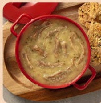
Caldo de Mandioca com Costela Swift