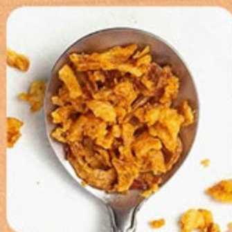
Cebola Crispy Swift