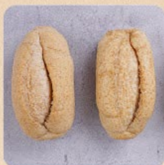
Pão Francês Integral Swift