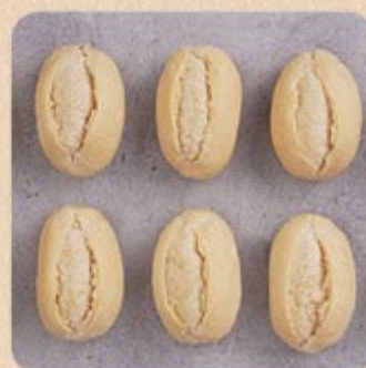
Mini Pão Francês Swift