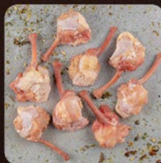
Tulipa Invertida Temperada Swift