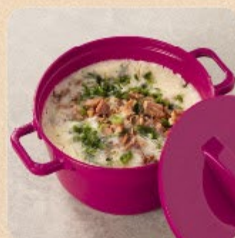
Caldo de Batata com Bacon Swift