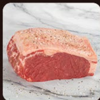
Contra Filé Combo Swift