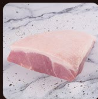
Picanha Suína Grill Swift