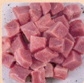
Cubos de Filé-Mignon Suíno Swift