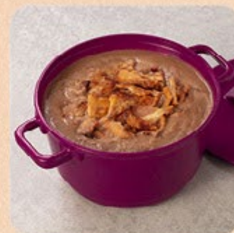
Caldo de Feijão Swift